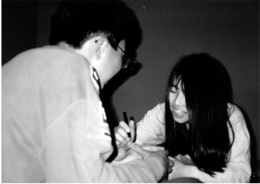
スキー合宿で戯れる二人。平成4年2月(当時16歳)