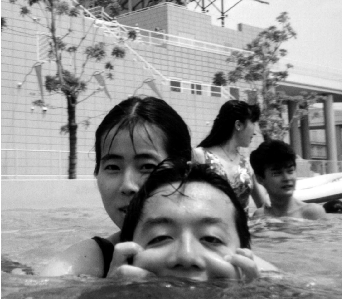
プールでのツーショット。平成4年7月(当時17歳)